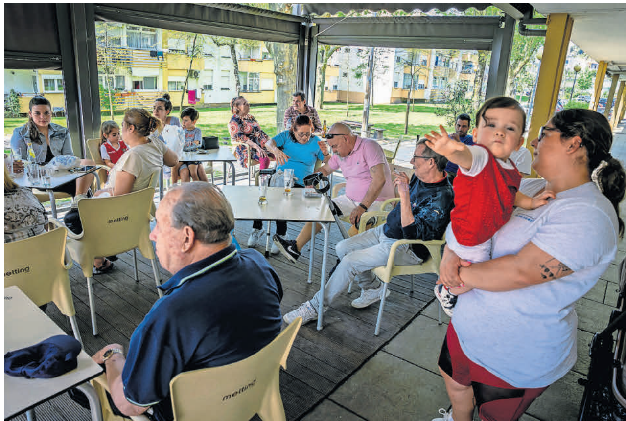
As obras de reabilitação a decorrer no bairro das Andorinhas, em Braga, eram há muito desejadas